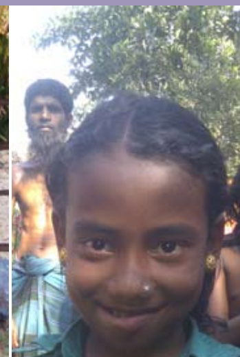
Die Bereitstellung von Nähmaschinen und Wasserpumpen schafft eine Überlebensgrundlage für ganze Familien und Communities.