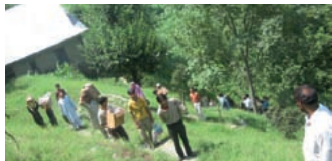
Der gebirgige Kaschmir ist oft nur noch zu Fuss erreichbar