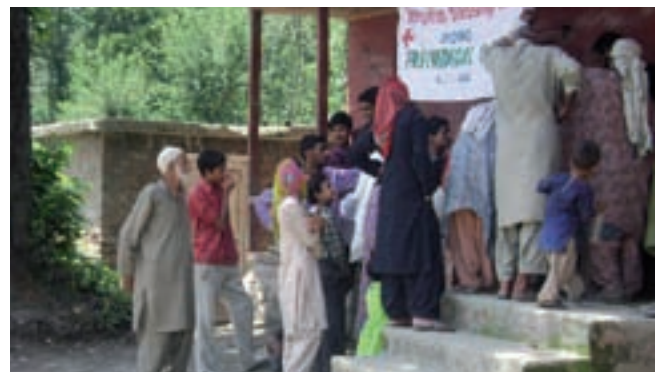
Durchführung eines «medical camp» im Kaschmir