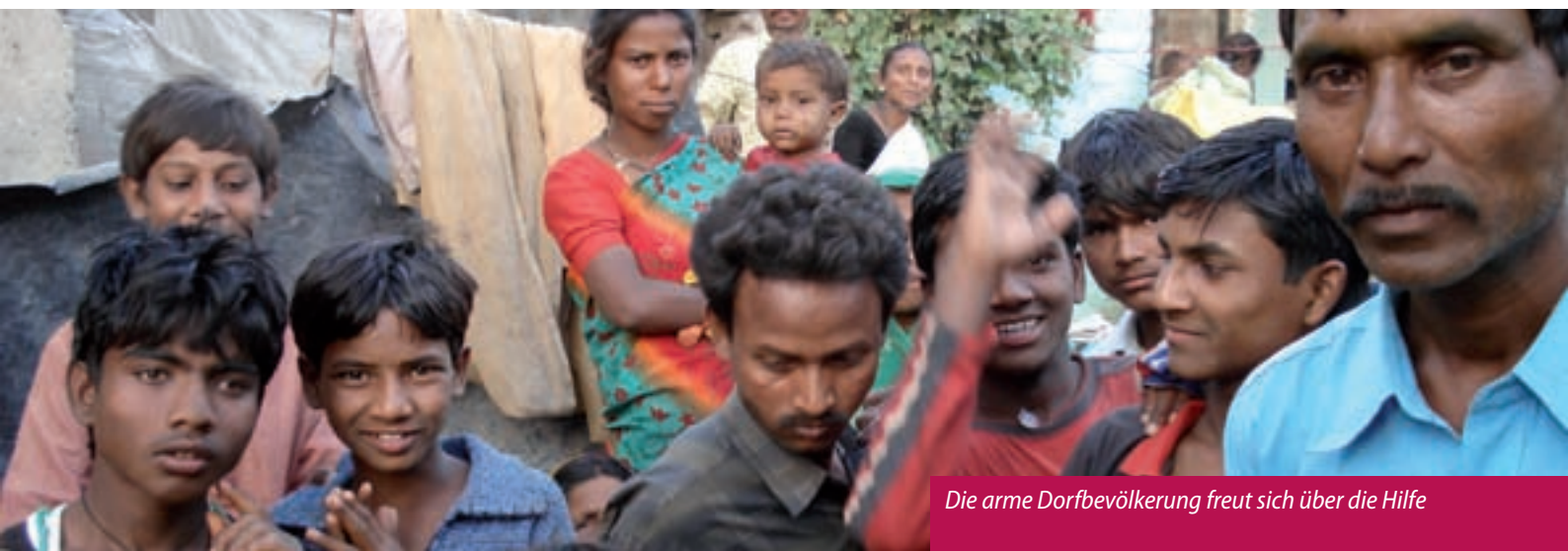
Die arme Dorfbevölkerung freut sich über die Hilfe